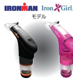
特別強化用商品 (商品のお取扱いはお問い合わせください。)